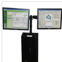
Single & Dual Monitor Mount & 30" Pole für NB, PC & Apex Series