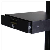
Lockable 3" Drawer für NB & PC Series

Eine Auswahl des aktuell verfügbaren Zubehörs finden Sie unten. Das komplette modulare Zubehörprogramm finden Sie unter www.newcastlesys.com/accessories .