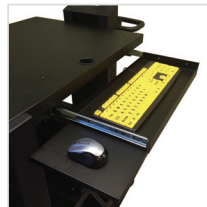
Keyboard Drawer für NB, PC & Apex Series