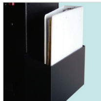
Binder Holder für NB & PC Series