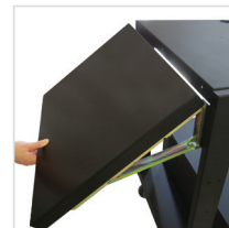
Folding Shelf für PC Series