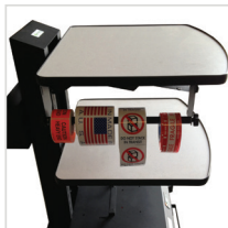
Label Holder für NB & PC Series