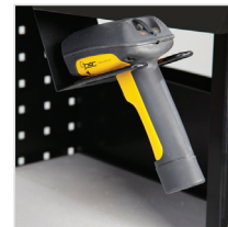
Scanner Holder für NB, PC & Apex Series