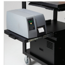
Slide-Out Printer Tray für NB & PC Series