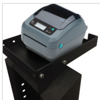
Small Printer Tray für NB & PC Series